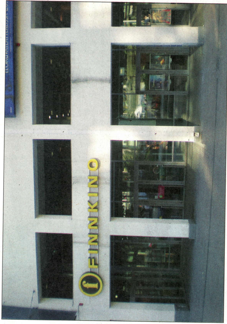
il Tennispalatsi di Kamppi

Il Tennispalatsi vanta alcuni primi singolari: lo schermo 1 non solo è il più grande del Paese (703 posti), ma è anche recentemente diventato 100% digitale. Il proiettore 35mm ha, infatti, ceduto il posto a un Christie 2K attrezzato pure